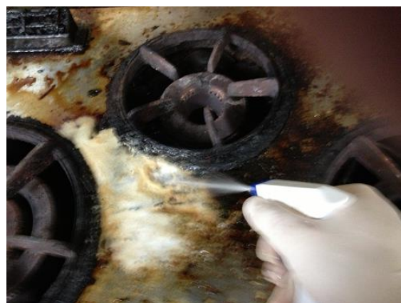
②レチキュアAL（原液）を専用のスプレーに入れ汚れに吹きかけます。